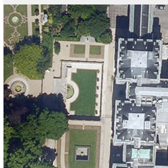
Jardin du Luxembourg, France